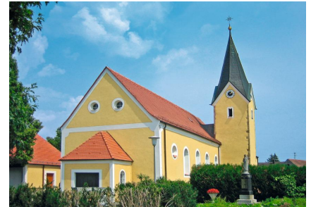
St. Margaretha - Pfelling