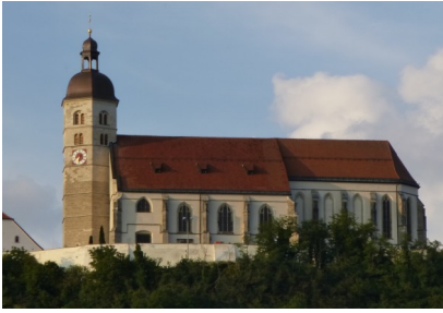
Mariä Himmelfahrt – Bogenberg