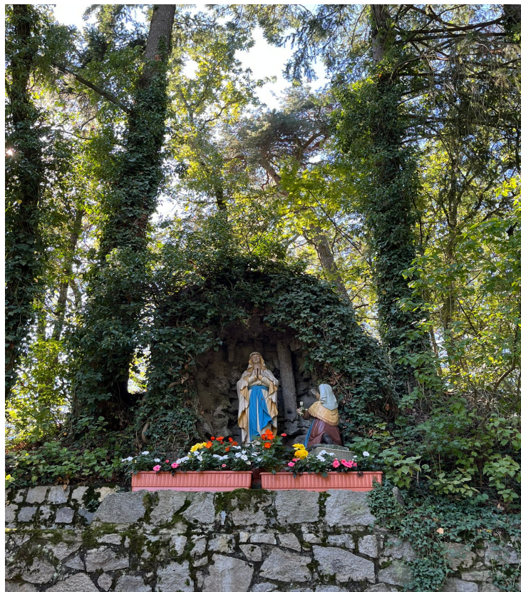
Mariengrotte am Bogenberg