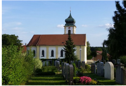
St. Andreas - Degernbach