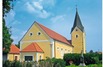
St. Margaretha - Pfelling